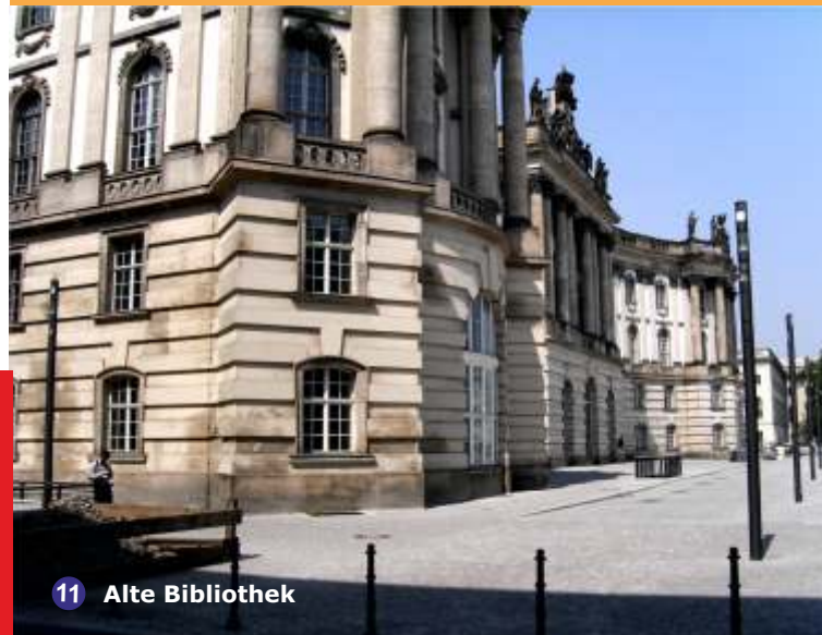
11 Alte Bibliothek

mobiletour & handytour - Informationen auf moderne Art interessant kommuniziert!