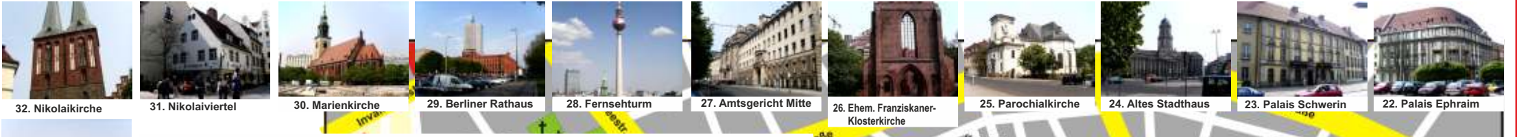
32. Nikolaikirche 31. Nikolaiviertel 30. Marienkirche 29. Berliner Rathaus 28. Fernsehturm 27. Amtsgericht Mitte 26. Ehem. Franziskaner-Klosterkirche 25. Parochialkirche 24. Altes Stadthaus 23. Palais Schwerin 22. Palais Ephraim