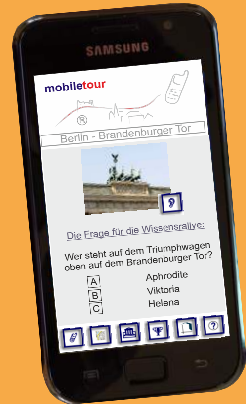
1 Brandenburger Tor