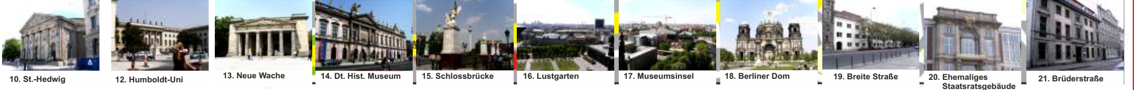
10. St.-Hedwig 12. Humboldt-Uni 13. Neue Wache 14. Dt. Hist. Museum 15. Schlossbrücke 16. Lustgarten 17. Museumsinsel 18. Berliner Dom 19. Breite Straße 20. Ehemaliges Staatsratsgebäude 21. Brüderstraße