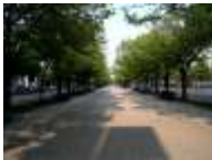
3+4. Unter den Linden