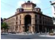
36. Oranienburger Str.