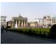
2. Pariser Platz

Sie haben die Möglichkeit diese wahlweise zu lesen oder zu hören. Hörend können Sie sich ganz auf das Sehen konzentrieren und den Augenblick genießen. Als Zusatz enthält die App eine Wissensrallye und einen Stadtplan mit den einzelnen Stationen. Bei Fragen gehen Sie in der App auf den Menüpunkt mit dem „?“.