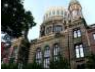
37. Neue Synagoge