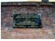
35. Alter Jüdischer Friedhof