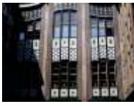
33. Hackeschen Höfe