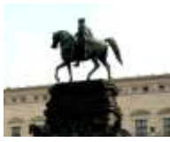
5. Friedrich der Große