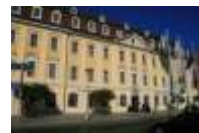
27. Neues Gewandhaus