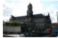
20. Neues Ständehaus