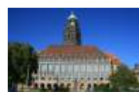
26. Neues Rathaus