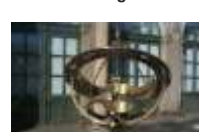
10. Mathe.-Phys. Salon