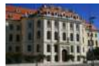
28. Altes Landhaus