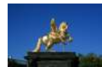
33. Goldene Reiter