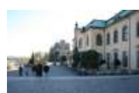
15. Brühlsche Terrasse