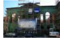
29. Kurländer Palais