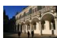
22. Stallhof/Langer Gang