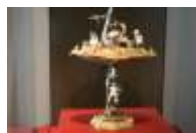
3. Grünes Gewölbe