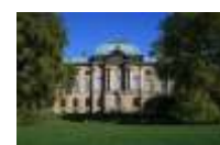
38. Japanisches Palais