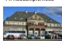
12. Ital. Dörfchen