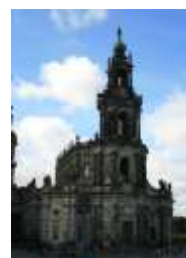
13. St. Trinitatis