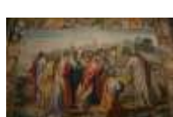
7. Alte Meister