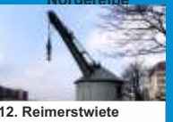
12. Reimerstwierte und Cremon