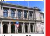
21. Hamburger Börse