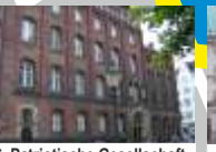
16. Patriotische Gesellschaft