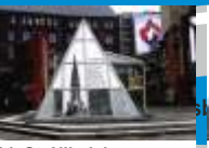
14. St. Nikolai