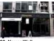
20. Neuer Wall