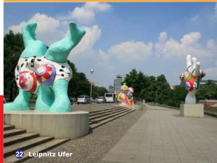
22 Leinritz Ufer

mobiletour & handytour - Informationen auf moderne Art interessant kommuniziert!